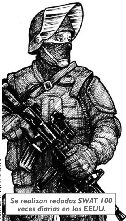
ARTIST: Matt Heff, tyothewolves.com

• Desde el año 1990 dentro del Programa sobre el Exceso de Propiedad, se ha transferido $4 mil millones de equipo a los departamentos estatales y locales de la policía, entre ellos lanzadores de granadas, helicópteros, robots militares, bayonetas, vehículos blindados, trajes de faena, etc.