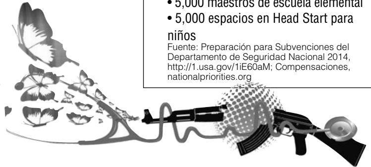
Graphic by Lemni Auxilio

De balas a misiles balísticos, de la policía local a la venta internacional de armas, los dólares estadounidenses recaudados en impuestos son invertidos a altos niveles en "soluciones" militares. Al mismo tiempo, el Índice de Paz Global señala una tendencia de 7 años hacia un aumento de violencia a nivel mundial; altos contratistas del Pentágono están batiendo récords en precios de acciones; y las naciones más poderosas en la Naciones Unidas son los más grandes comerciantes de armas. Tome una de las acciones listadas a continuación para hacer un cambio por la paz.