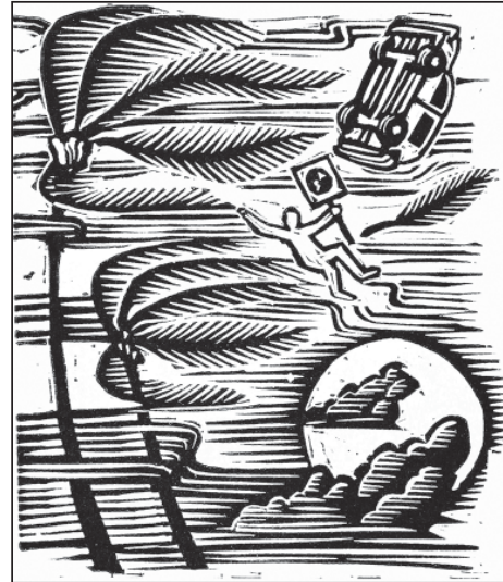
Roger Peet, Justseeds Artists' Cooperative, justseeds.org

La milicia estadounidense, el contaminador más grande del planeta, liberó 1,2 mil millones de toneladas métricas de gases de invernadero desde 2001; lanzó 63 millones de libras de veneno al agua entre 2010 y 2014; consume por lo menos 100 millones de barriles de petróleo al año. Y, en vez de financiar armas nucleares por un año, podríamos crear 300.000 empleos de energía limpia. Poner fin a la guerra sería un gran paso hacia la salvación del Planeta Tierra.