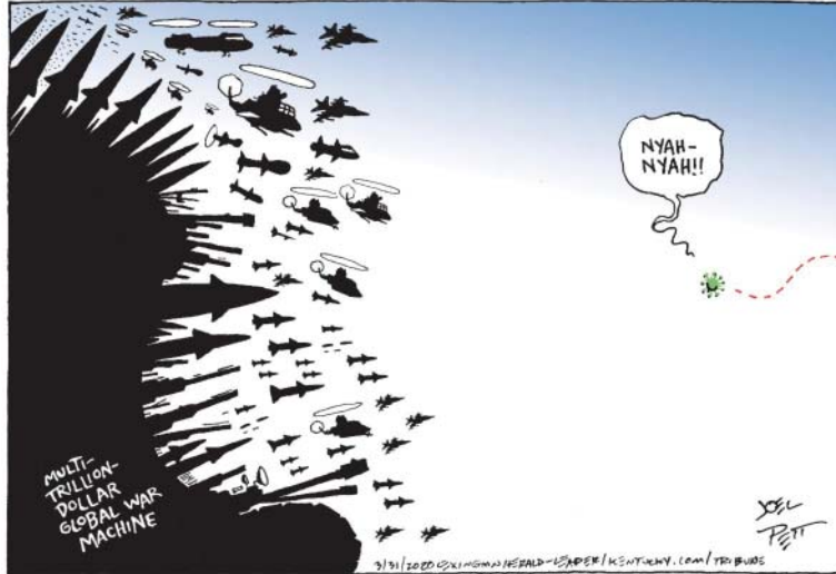
Derechos de autor de Joel Pett y usado con su permiso

Las amenazas principales para nuestra sociedad — pandemias, crisis climática, amenazas domésticas — no pueden detenerse con tropas y bombas. Necesitamos repensar la seguridad nacional y redirigir fondos de la milicia a la prevención, la reparación y el cuidado.